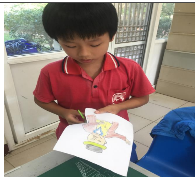
小記者發表前：製作道具。