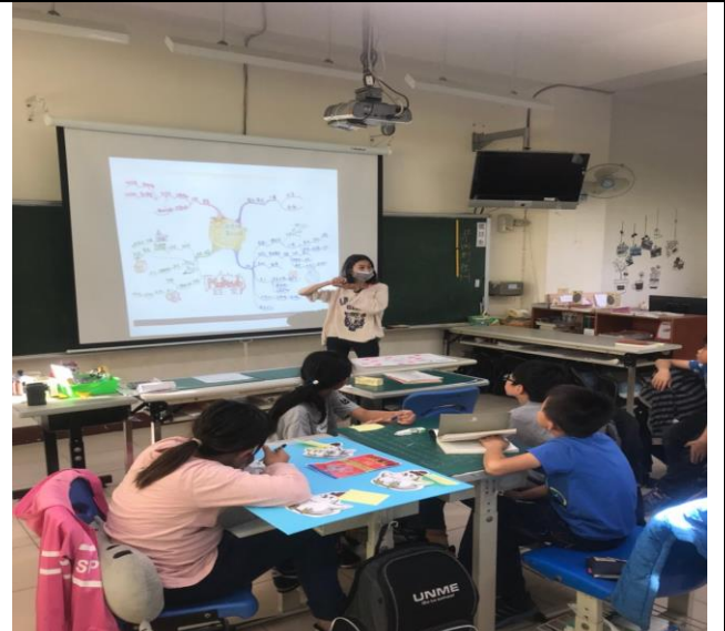
共讀時間：老師指導心智圖的製作方法。