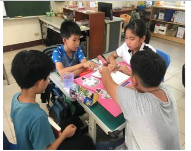
共讀討論時間：推盤沙演一番。