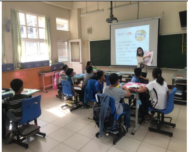
共讀時間：老師指導心智圖的製作方法。