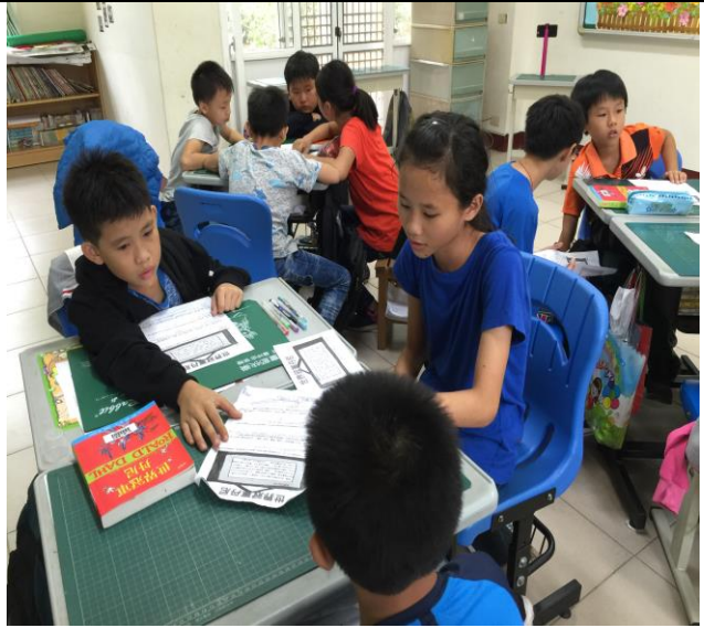
共讀討論時間：各別提出想法與建議。