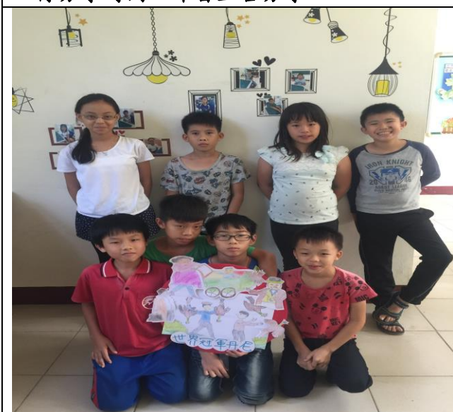
發表道具順利完成，大合照。