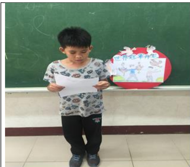
心得分享時間：練習上台分享。