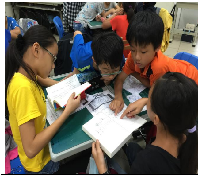
共讀討論時間：找出最觸動人心的一篇章