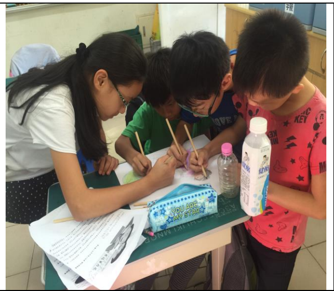
共讀合作時間：齊心完成發表道具。