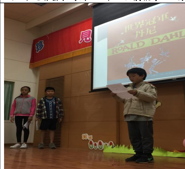
誠品小記者發表時間：五甲古順鑫報導。