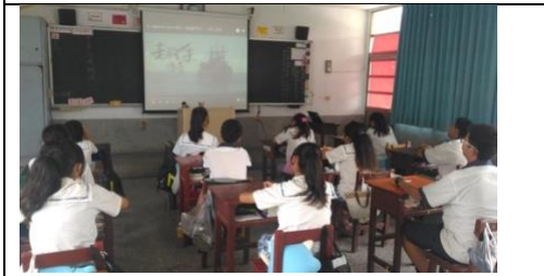
老釣手傳奇影片欣賞。