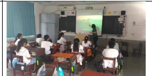
海洋生態影片討論。